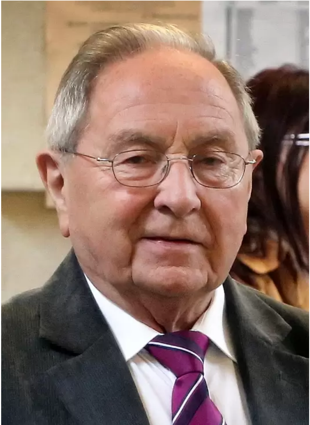
Franz Josef Mönks