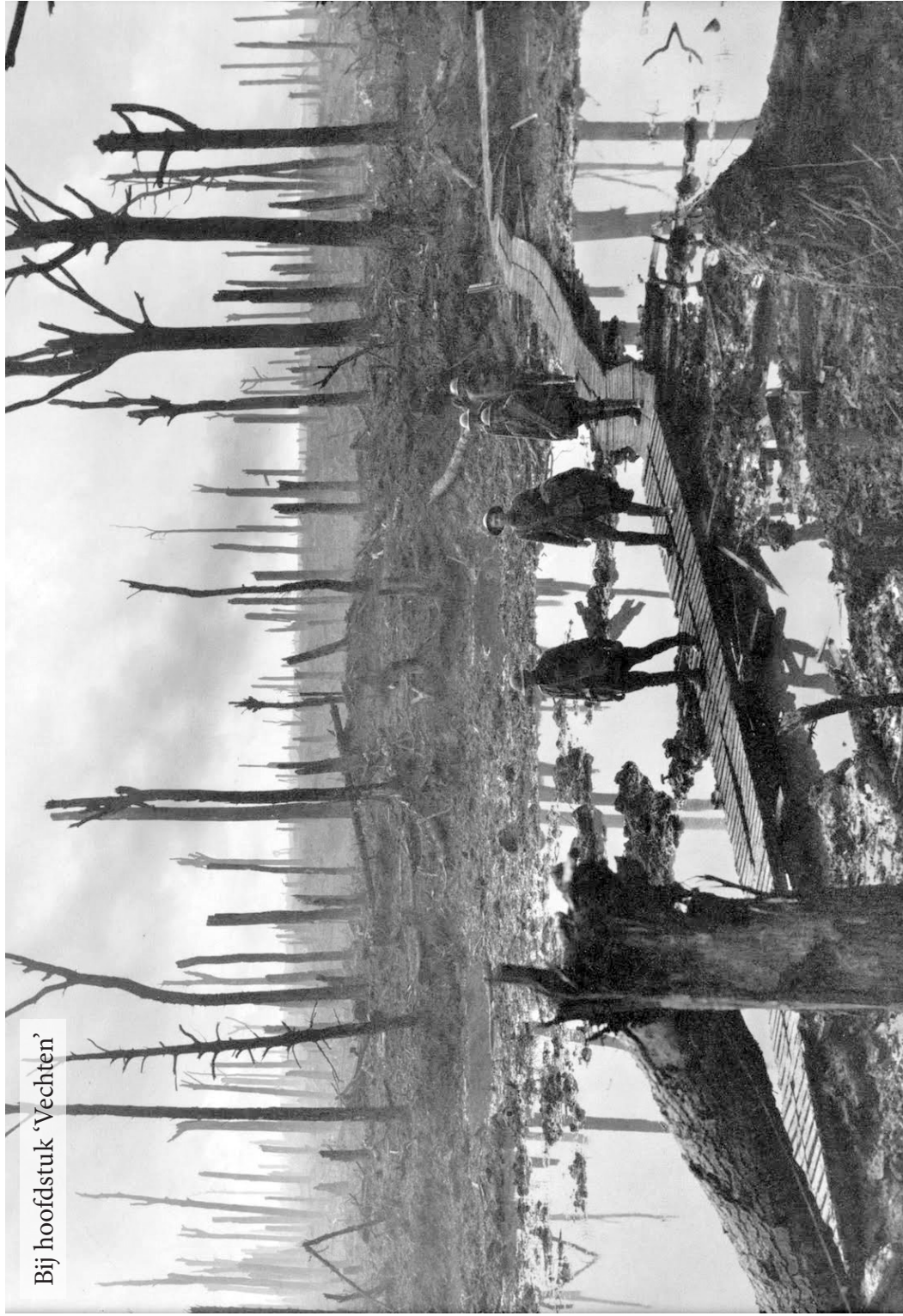
Bij hoofdstuk 'Vechten'