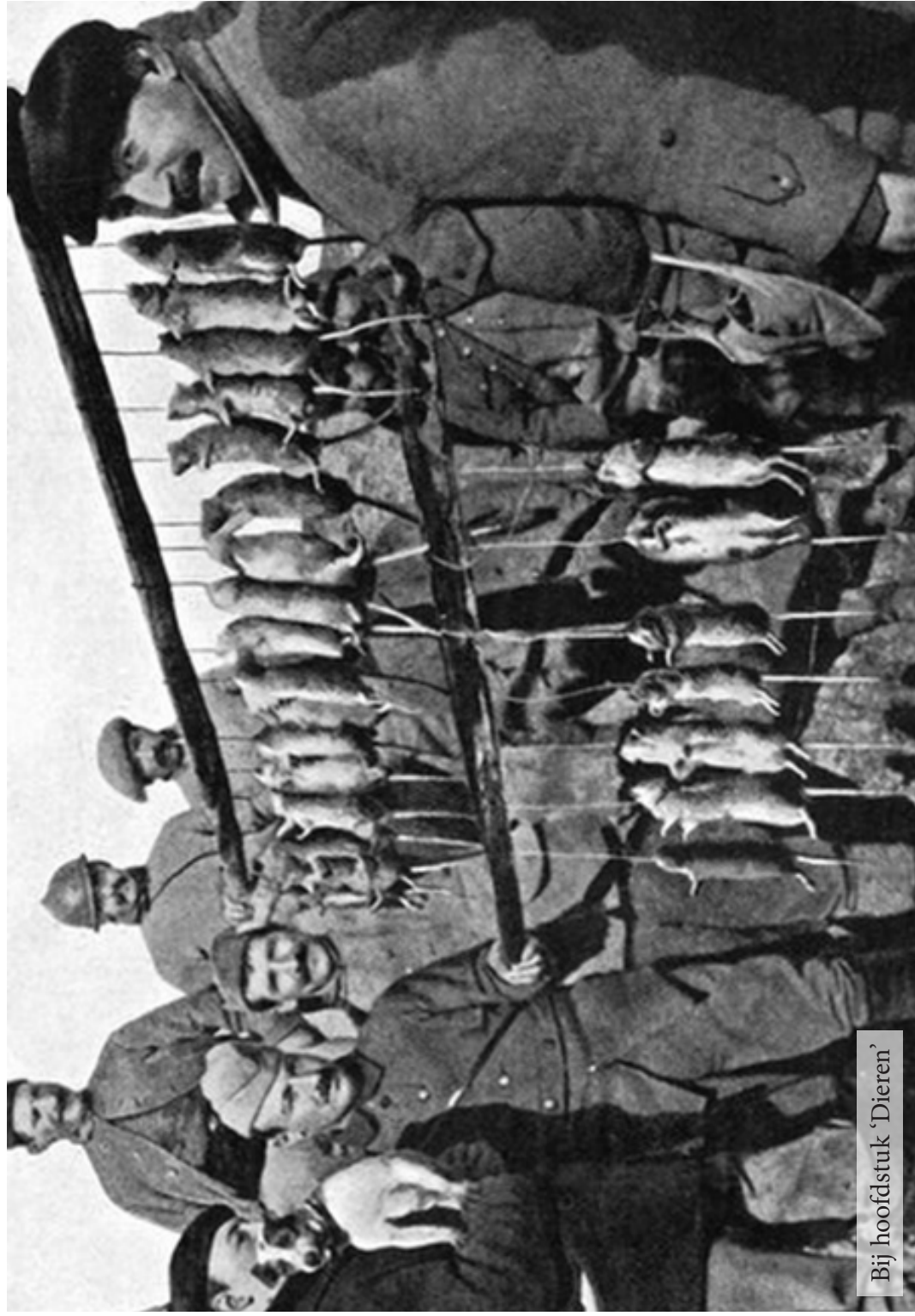
Bij hoofdstuk 'Dieren'