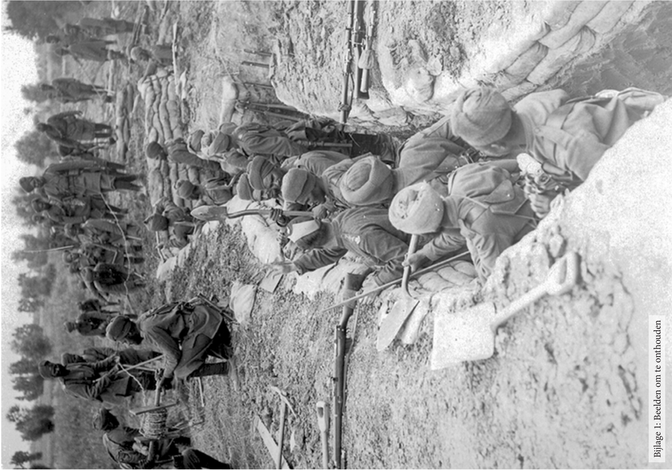
Bijlage 1: Beelden om te onthouden